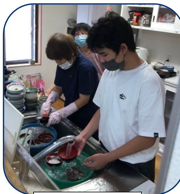
お皿洗いありがとう