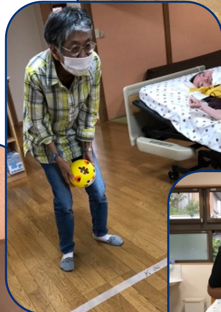
ひらすま ボウリング ゲーム