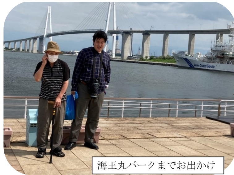
海王丸パークまでお出かけ