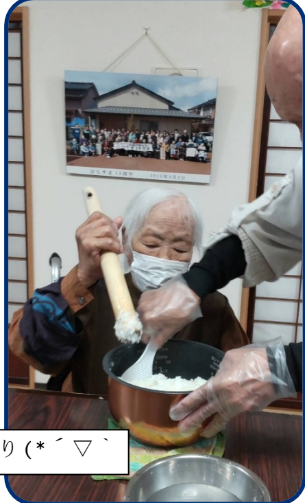
お彼岸におはぎ作り(*´▽`)