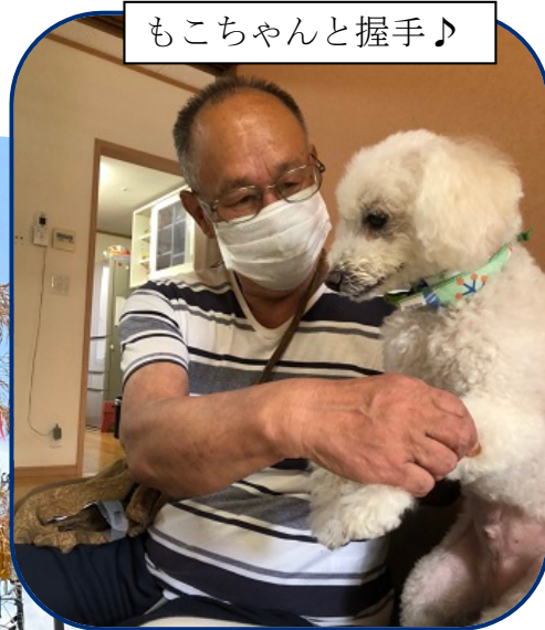
もこちゃんと握手♪