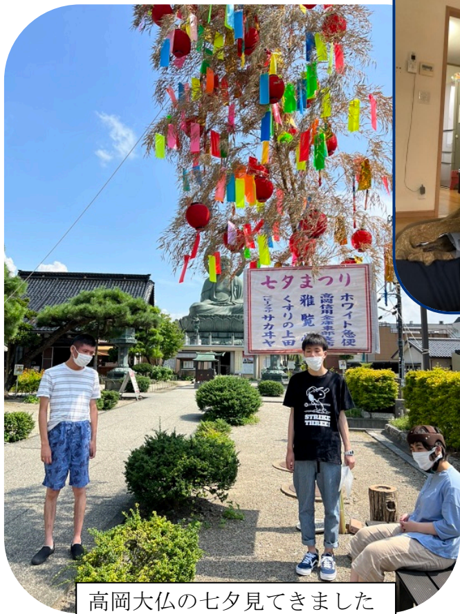
高岡大仏の七夕見てきました