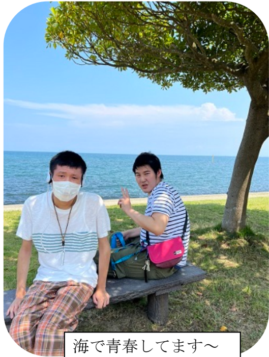
海で青春してます～