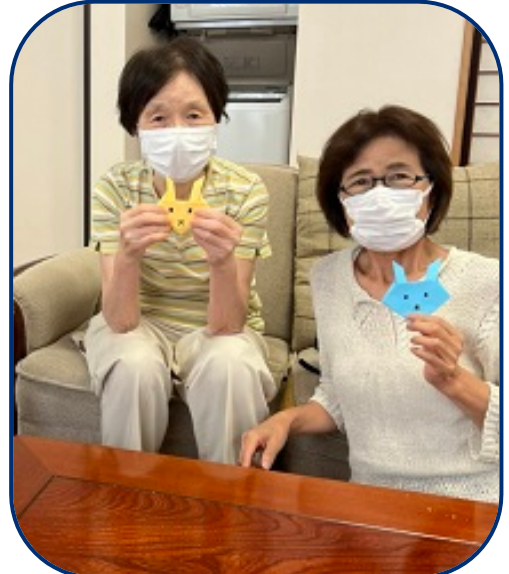
折り紙でキツネ折りました！