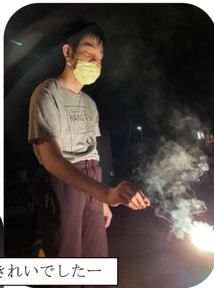
花火きれいでしたー