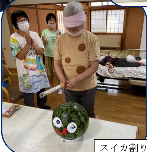
スイカ割りがんばれー