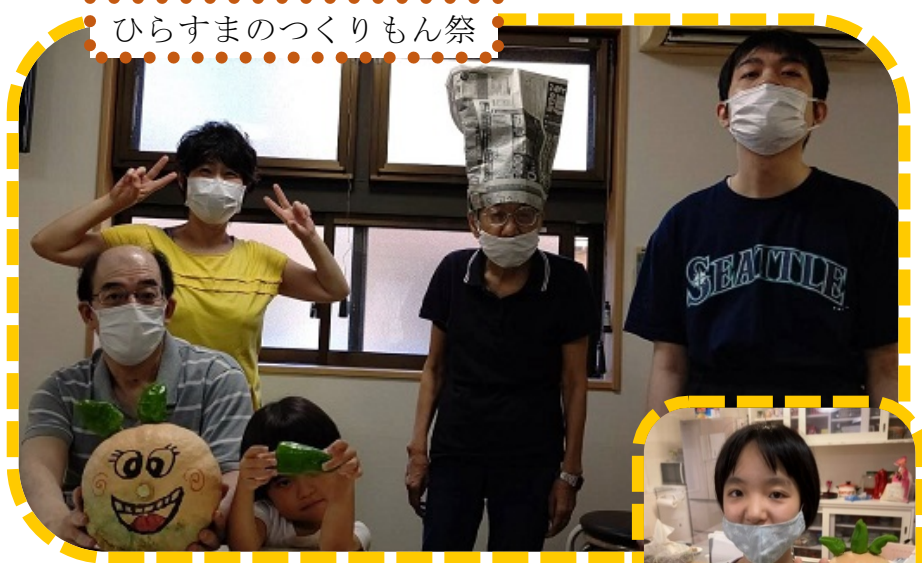
ひらすまのつくりもん祭