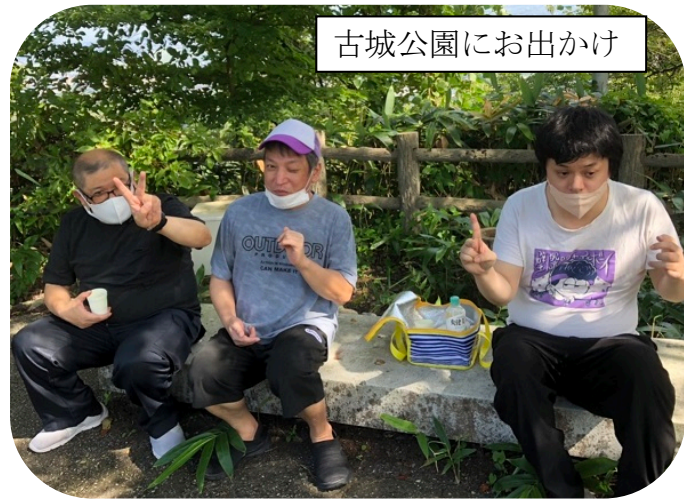
古城公園にお出かけ