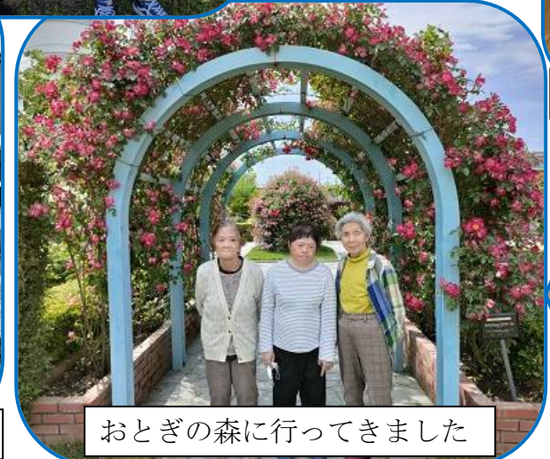
おとぎの森に行ってきました