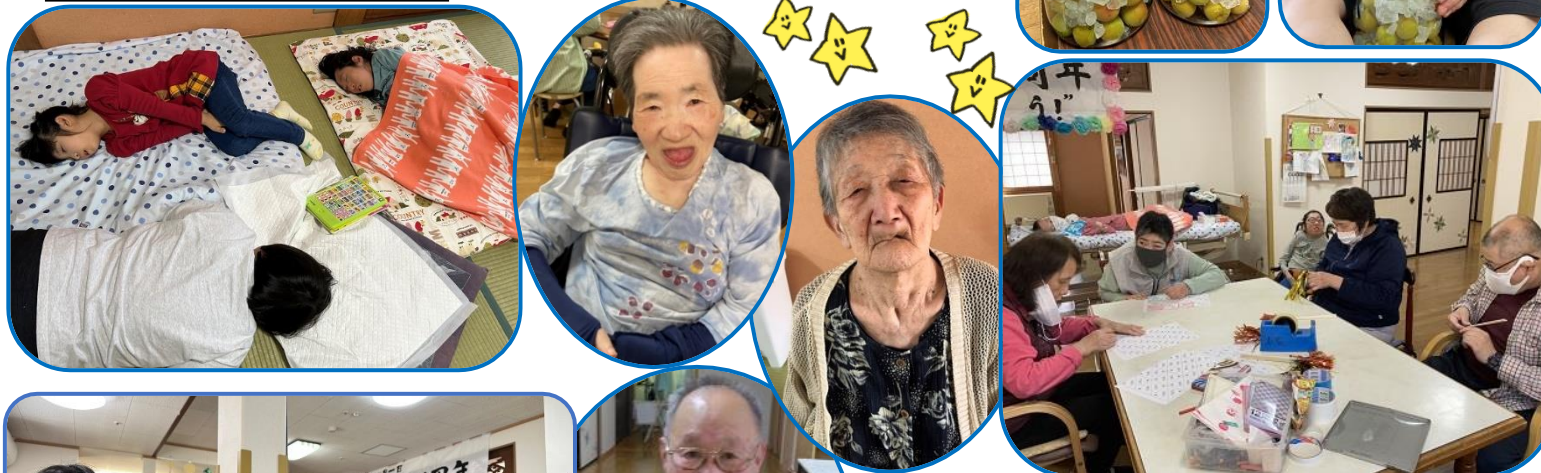
今年も梅を頂きました!