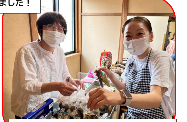
Jam さんのクッキーや雑貨の販売