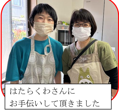
はたらくわさんにお手伝いして頂きました