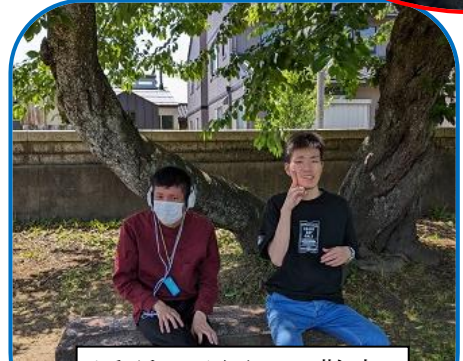
近所の公園へお散歩