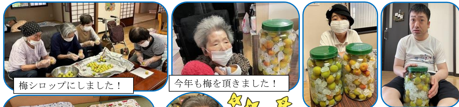
梅シロップにしました!