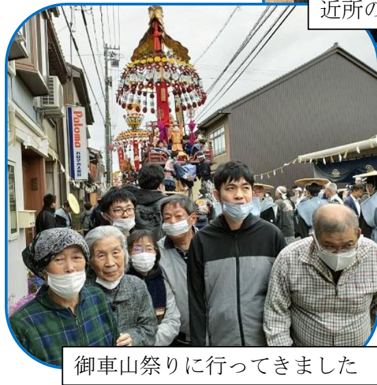
御車山祭りに行ってきました