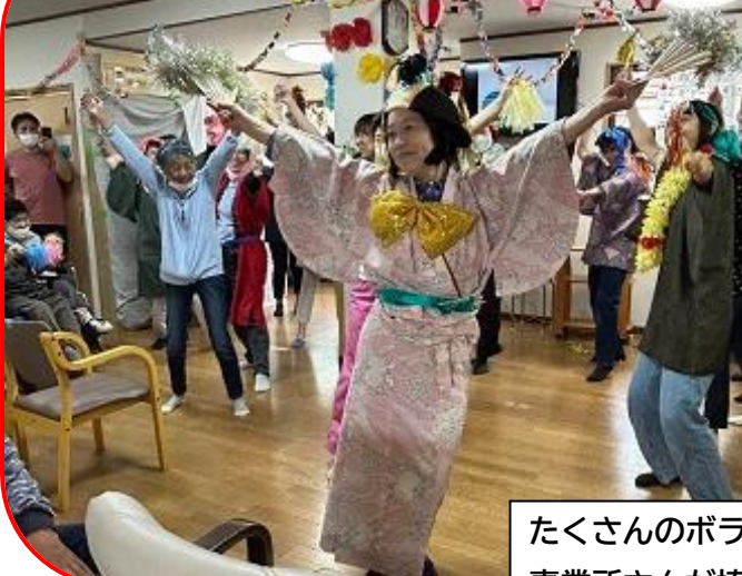
スタッフ一同によるマツケンサンバ