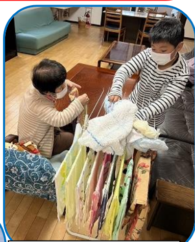
お手伝いありがとう