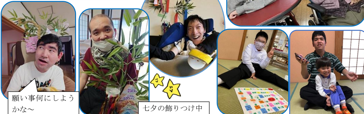
願い事何にしようかな~