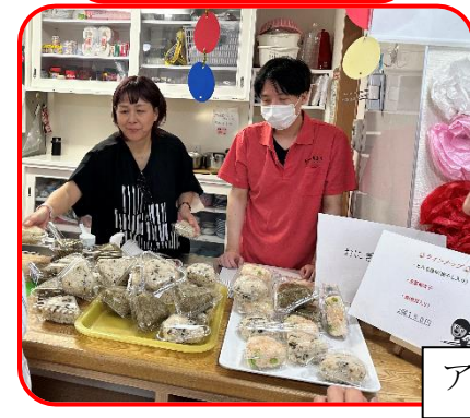
アフレックスさんのおにぎり販売