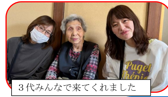
3代みんなで来てくれました