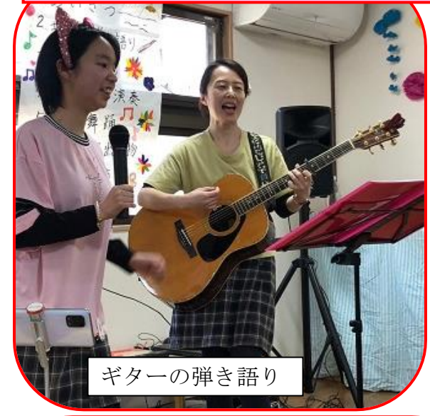
ギターの弾き語り