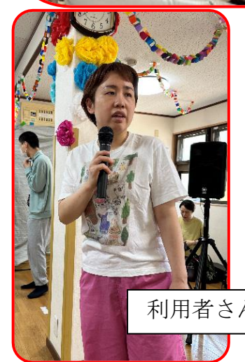
利用者さんによる歌や踊り♪