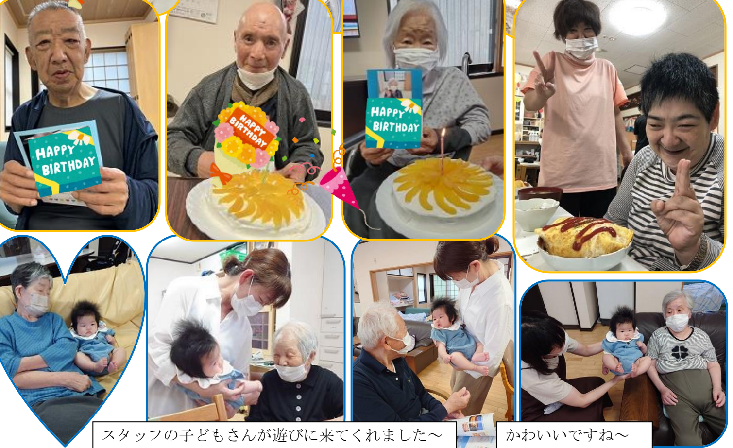
スタッフの子どもさんが遊びに来てくれました~