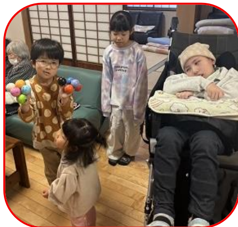
完成した作品と一緒にハイポーズ♪