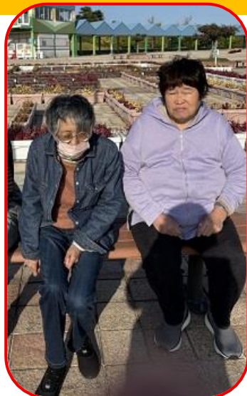
海王丸パークにて