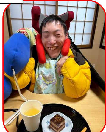
チョコケーキでご満悦