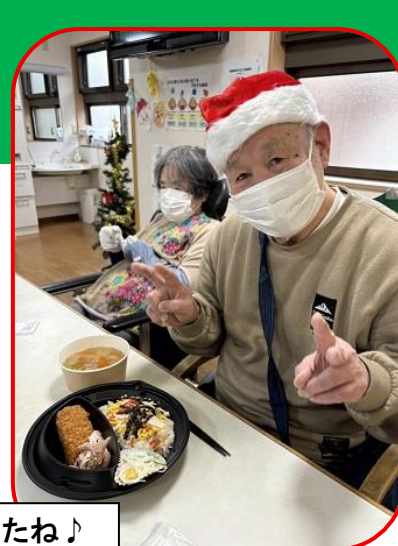
チキン柔らかくて美味しかったね♪