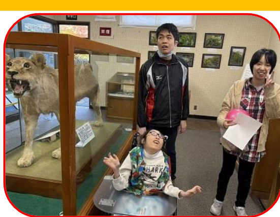
古城公園の動物園に行って来ました