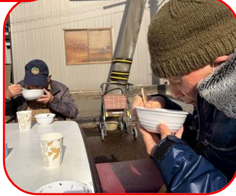
きなこ餅にあんこのトッピング最高〜♪