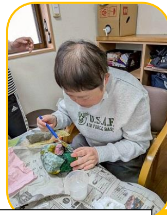
新聞と和紙でかぼちゃを作りました