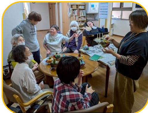
先生と一緒に作品鑑賞会