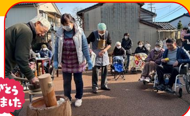
豚汁の下準備、餅つき、餅の成型などたくさんの方にボランティアとしてお手伝いして頂きました