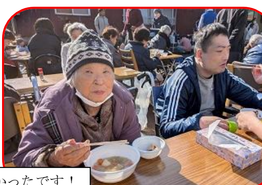
お餅と豚汁とっても美味しかったです！