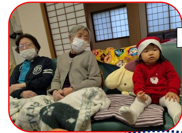
かわいいサンタさんたち