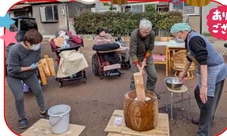
大ベテランの70代コンビによる 息の合った餅つきの姿、とっても素敵(^^)/