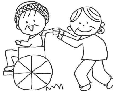
共同生活の中で、住人同士のふれあい。