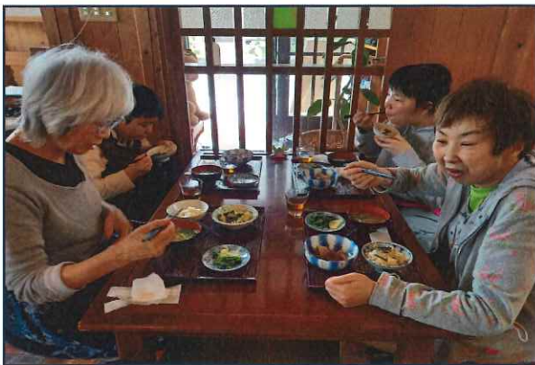
にぎやか食堂さんで、旬の味 お茶キャンプ?!