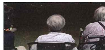
むかしなつかし線香花火